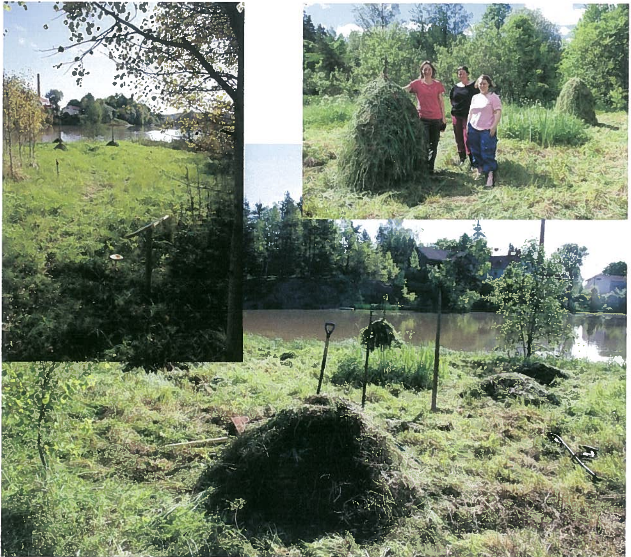
Juvan voimalaitoksen patovallin hoitotöitä, joiden tuloksena syntyi Juvantieltä patovallin kärkeen ulottuva polku ja sen varrelle luontotauluja.

Juvan voimalaitosalueen kehittämistyötä jatketaan vuonna 2015 yhteistyössä paikallisen kotiseutuyhdistyksen kanssa ja Turun yliopiston kansatieteen laitoksen kanssa.