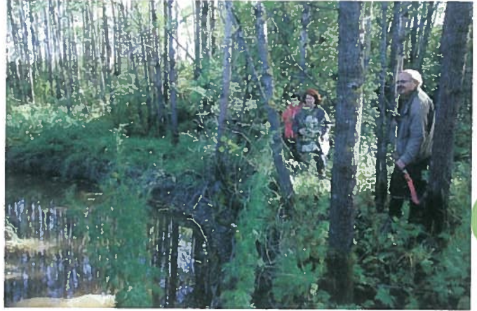
Yleisöretki Hirvasojalla 13.9.2014 Marttilan Ollilan kylätoimikunnan kanssa.

Puroja kuntoon Paimionjoella kehittämishanke vahvisti käsitystä siitä, että yleisölle suunnatuilla maastokäynneillä ja avoimella, läpinäkyvällä keskustelulla voidaan positiivisella tavalla aidosti vaikuttaa asenteisiin, purkaa virheellisiä käsityksiä ja tuoda Paimionjoen vielä osittain tuntemattomiksi jääneet arvokkaat luonnonympäristöt ja kulttuuriympäristöt hoidon piiriin ja tätä kautta erityisesti paikallisen väestön saavutettavaksi.