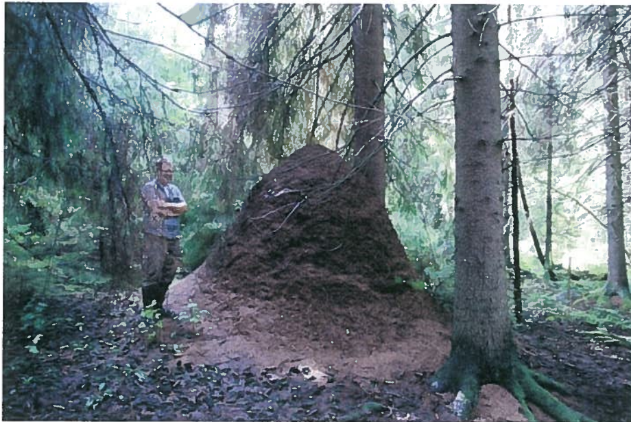
Maastokatselmus Hirvasojalla. Mittausteknikko ja muurahaiskeko kohtaavat yllättävässä ojaympäristössä.