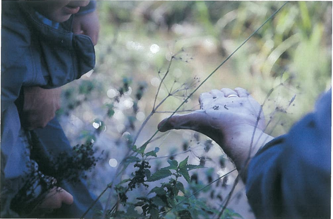
Hirvasojan yleisöretkellä 13.9.14 ihmetellään ojan elämän merkkejä.