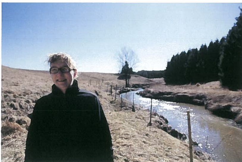
Tukiryhmän katselmus 10.4.2014 Pöytyällä, Tarvasjoen varrella.

Kaikissa tämän hankkeen aikana löydettyissä ja työn alle saatetuissa kohteissa tullaan näkemään jo vuodesta 2015 lähtien merkittäviä käytännön ympäristötoimia.